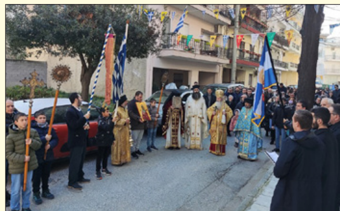
ήμέρας έκφώνησε ο π. Έλευθέριος, στο τέλος δέ τής Θείας Λειτουργίας πραγματοποιήθηκε Ίερά Λιτανεία.

Άγιου Σπυριδώνος. Στο Γαλάτσι Άθηνών στον όμώνυμο Ναό στον Μ. Έσπερινό χοροστάτησε ό Σεβ. Δημητριάδος κ. Φώτιος και τό πρωί τής Θ. Λειτουργίας προέστη ό Μακαριώτατος Άρχιεπίσκοπος Άθηνών κ. Καλλίνικος, ό όποίος λειτούργησε μετά του Έφημερίου Ίερομ. π. Άβερκίου, τελεσθείσης και ι. Λιτανείας.