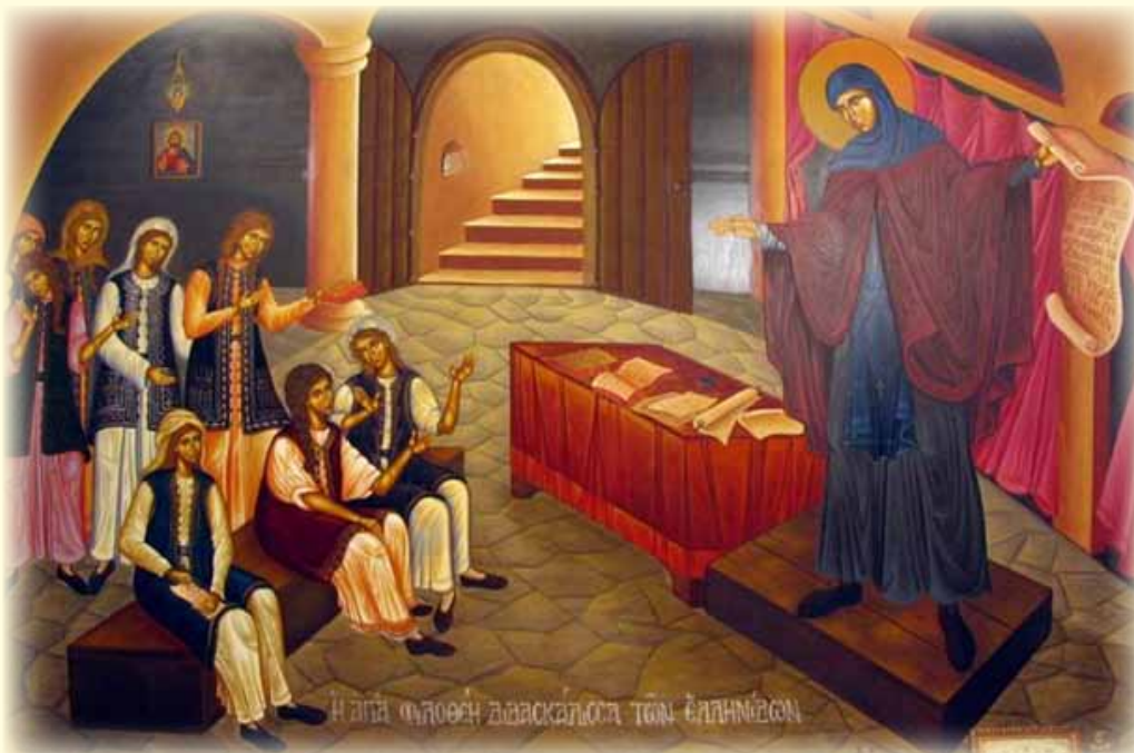
Ἡ Ἁγία Φιλοθέη διδάσκαλος τῶν Ἑλληνίδων