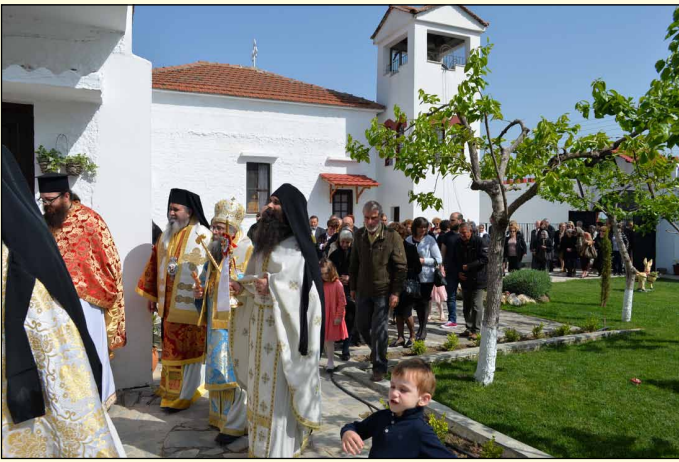
Πειραιώς και Σαλαμίνας κ. Γεροντίου, καθώς και πέντε Ίερέων, παρουσία πλήθους πιστών.