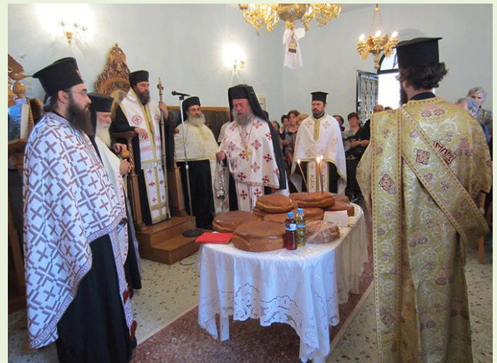
Ἀπὸ τὴν ἐορτὴ τῆς Ἁγίας Παρασκευῆς