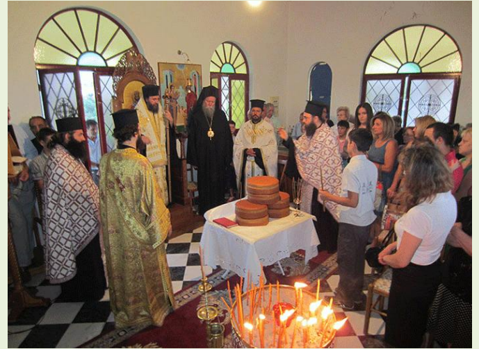
Ἀπὸ τὴν ἐορτὴ τοῦ Προφήτου Ἡλιοῦ

Βοιωτίας κ. Χρυσόστομος συμπαραστατούμενος ὑπὸ τοῦ Σεβ. Πόρτλαντ κ. Μαυσιέως περιστοιχούμενοι ὑπὸ τοῦ ἱεροῦ κλήρου τῆς Μητροπόλεως.