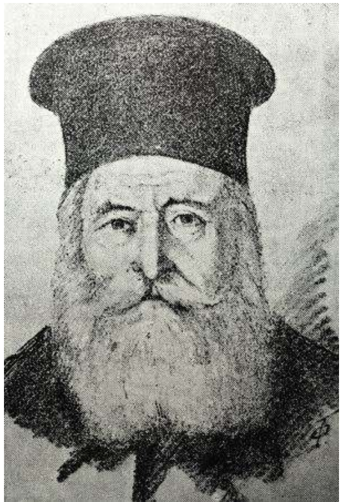
Μητροπολίτης Μισαήλ Αποστολίδης

Ο πρώτος από αυτούς είναι ο Μισαήλ Αποστολίδης, ένας από τους πρώτους καθηγητές του Πανεπιστημίου, το 1837, και ένας εκ των ιδρυτών της Φιλεκπαιδευτικής Εταιρίας, ο οποίος έμαθε ελληνικά στον νεαρό Όθωνα, στο Μόναχο. Σε αντίθεση με τα όσα ανακριβή λέει ο Αγγέλου[279], ο Μισαήλ Αποστολίδης το 1837 δεν ήταν μητροπολίτης Αθηνών, αλλά απλός αρχιμανδρίτης. Ο Μισαήλ έγινε ανώτατος κληρικός πολύ μετά, το 1851 (αρχιεπίσκοπος Πατρών και Ηλείας), ενώ μητροπολίτης Αθηνών έγινε μόλις το 1862, όποτε και πέθανε! Ούτε να το χαρεί δεν πρόλαβε ο άνθρωπος.